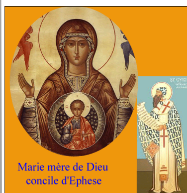
Marie mère de Dieu concile d'Ephèse

Aux ennemis de l'extérieur ont succédé les ennemis de l'intérieur appelés hérésiarques. D'où l'intervention de conciles évidemment sous l'autorité suprême du pape. Notre Seigneur Jésus-Christ s'est donc laissé bafouer de son vivant sur la terre de Palestine comme au ciel, après son ascension. Malheureusement la Très Sainte Vierge